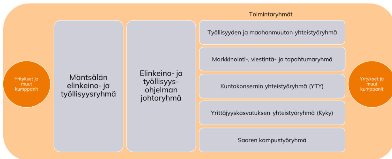
Kuva 2. Ohjelman työryhmät