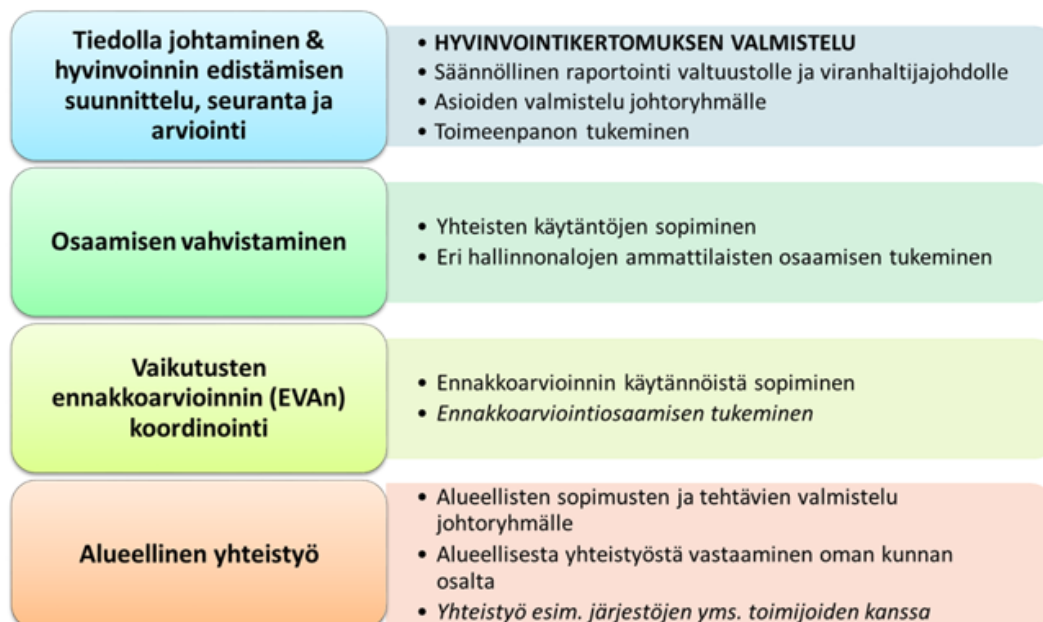
Kuva 2. Kunnan Hyte-työryhmän tehtävät

Kunnanhallituksen alaisuudessa toimii hyvinvointilautakunta, joka päättää kunnan avustuksista sekä toimii hytetyön sekä soteasioiden koordinaatiotoimielimenä.