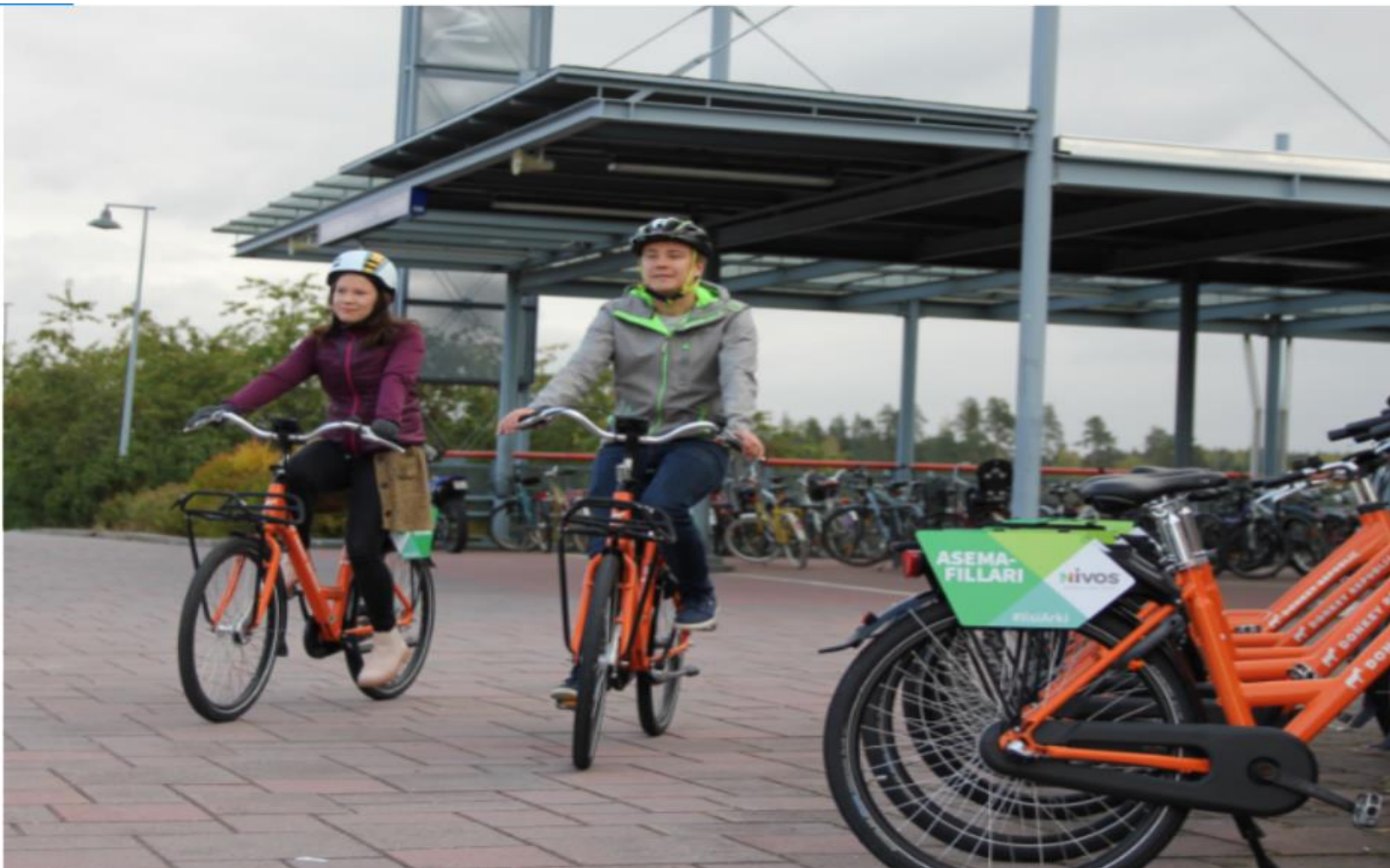
Kuva 1.