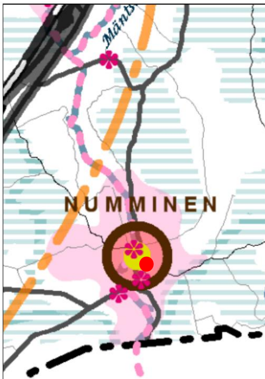
MAT:n karttakuvauus ja merkinnät kaava-alueelta

MAT:ssa Nummistien kylä osoitetaan palvelukyläsymbolilla. Arvokas kulttuuriympäristö osoitetaan aluerajauksena ja merkittävät kartanot pistemerkinöin. MAT edellyttävät suunnittelualueella luonnon- ja maisema-arvojen kannalta erityisen merkittävien alueiden huomioimista, asukkaiden ja palvelujen yhteensovittamista ja kulttuuriympäristön vaalimista.