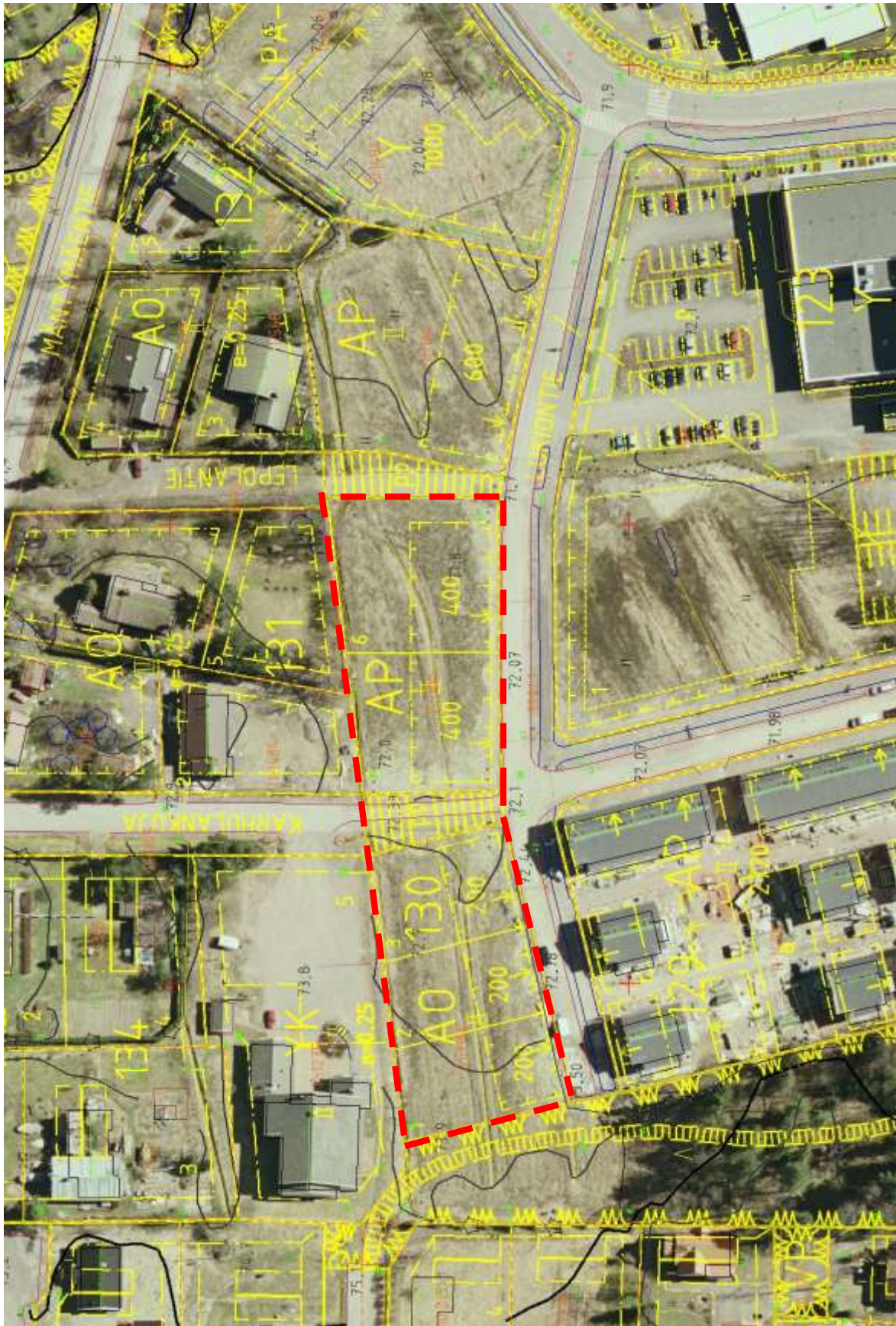
Liite 3. Kaava-alue ilmakuvalla