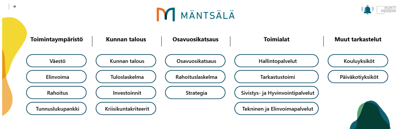
Kuva 1: Kuntamaiseman Power BI -raportin etusivu

Kuntamaiseman Power BI -raportin etusivu (Kuva 1) näyttää kootusti tiedot ryhmätasoisesti (esim. Osavuosikatsaus) sekä raporttitasoisesti kunkin ryhmän alla (esim. Osavuosikatsaus, Strategia). Voit siirtyä suoraan valitsemaasi raporttiin joko tältä sivulta tai vaihtoehtoisesti sivun alalaidassa kulkevasta raporttinauhasta. Mikäli haluat palata valitsemaltasi raportilta takaisin etusivulle, paina sivun vasemmassa ylälaidassa näkyvää talo-painiketta (pala etusivulle).