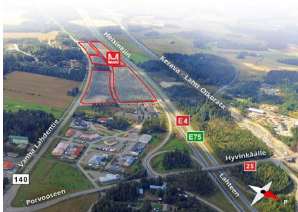
Mäntsälän eteläisessä moottoriteliittymässä sijaitsevat Mäntsälän Portin sekä Linnalan yritysalueet.

Mäntsälä muuttuu kuljetusten paikkakunnasta tavarankäsittelypaikkakunnaksi. Edellytyksenä kuitenkin on, että Mäntsälän rautatieasemalta Kapulin alueelle rakennetaan pistoraide.