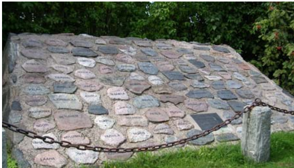
Torpparimuistomerkki Sälinkään kartanon pihalla.